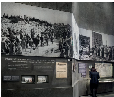
Prezentacja Pomnika Bohaterów Getta